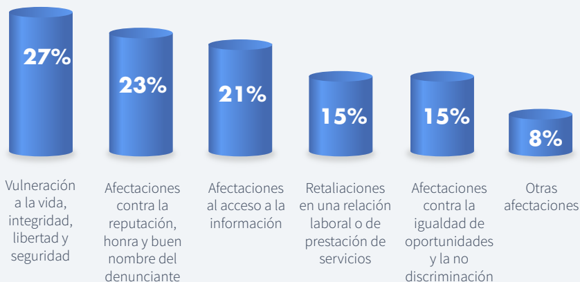
GRÁFICO 1: ¿POR CUALES RAZONES NO HA PRESENTADO O NO PRESENTARÍA DENUNCIAS POR CORRUPCIÓN?

1 Nota aclaratoria: La sumatoria de los porcentajes para esta pregunta puede exceder el 100%, por cuanto el cuestionario permitió a los encuestados escoger varias opciones de respuestas.